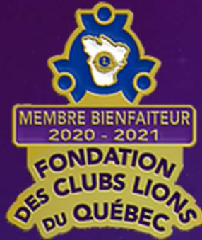
Contribution annuelle 20 $