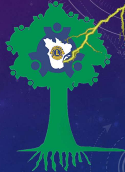
Contribution 250 $