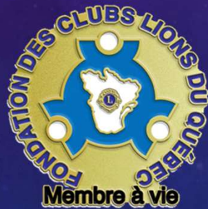
Contribution 75 $