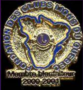
Première de la série des Bienfaiteurs