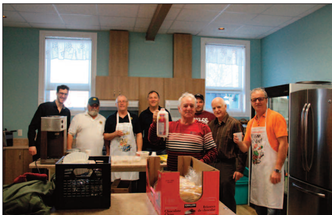
Les Lions ont bien préparé le déjeuner.

Le club Lions est fier de participer à l'Info-Lions. La fête de Noël a été bien soulignée par les membres et leur famille lors d'un déjeuner.