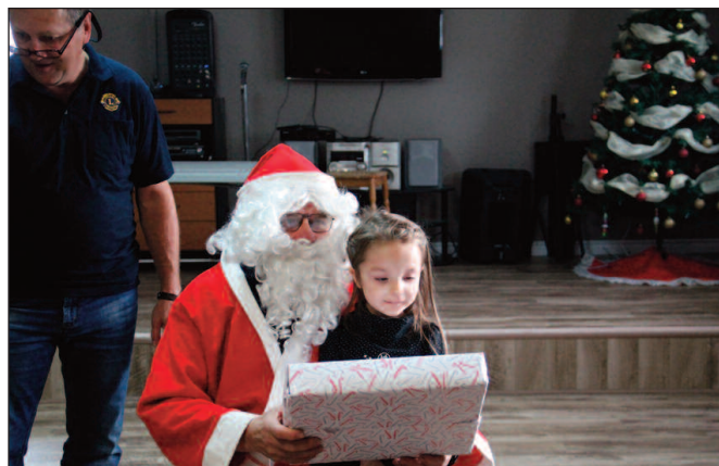
Tous les enfants ont reçu un cadeau qui fut apprécié.