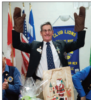
Jeu amusant avec le gouverneur