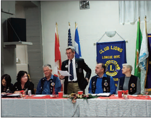
Mot du gouverneur