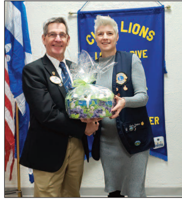
Présent remis au gouverneur