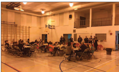
Déjeuner à l'école Longue-Rive