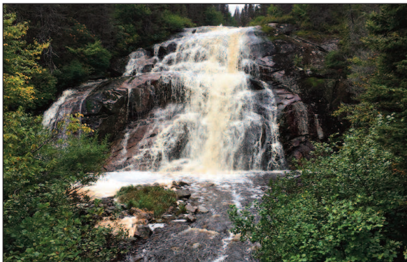
Catégorie Le paysage avec « La force de l'eau » Lion Dominique Gagné du club d'Escoumins Bergeronnes

Voici les gagnants de l'an passé. Bonne participation!