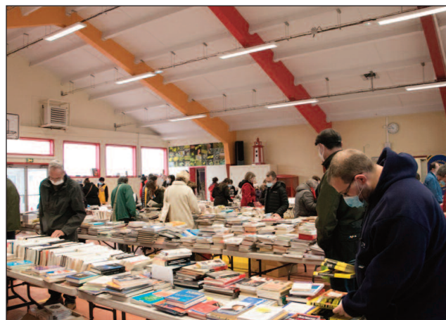
Les clients cherchent leur bonheur parmi des centaines d'ouvrages