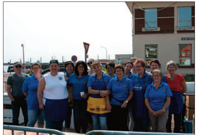
Une grande partie de nos membres ainsi que des conjoints et amis posent pour la photo avant le démarrage des festivités.