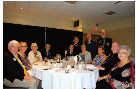
Les membres du District U-3