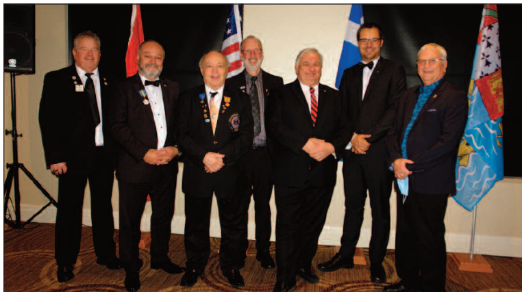
Le comité organisateur

Le souper du banquet était délicieux et que dire de la membre Lion du Club Cèdre du Liban de Montréal qui a agrémenté ce souper, quelle chanteuse animée! Je vous joins une photo de l'ambiance magique malgré les mesures sanitaires. Nous avons eu du plaisir et nous avons rechargé nos batteries pour l'année en cours.