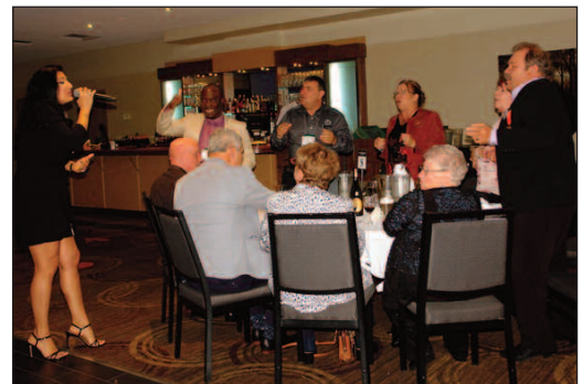
Une animation appréciée