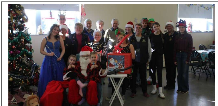
L'équipe des Lions et les bénévoles réunis, fiers d'avoir contribué au succès de l'événement.

Une fête de Noël placée sous le signe du partage et de la solidarité. À l'approche des fêtes, nous avons organisé une activité de Noël afin de rassembler notre communauté dans un esprit de générosité et de convivialité. L'objectif était d'offrir un moment chaleureux où petits et grands pouvaient partager la magie de Noël avec leur club Lions. À travers diverses animations, nous souhaitons renforcer nos liens avec la communauté, mettre en lumière les bienfaits d'un club Lions et profiter de cette occasion pour expliquer aux parents notre mission et notre engagement envers la jeunesse. Les familles Les familles étaient libres de rester aussi longtemps qu'elles le souhaitaient, et plusieurs ont profité de l'après-midi en notre compagnie.