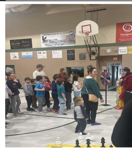
Les enfants font la queue pour jouer à la roue de fortune, moment magique pour eux