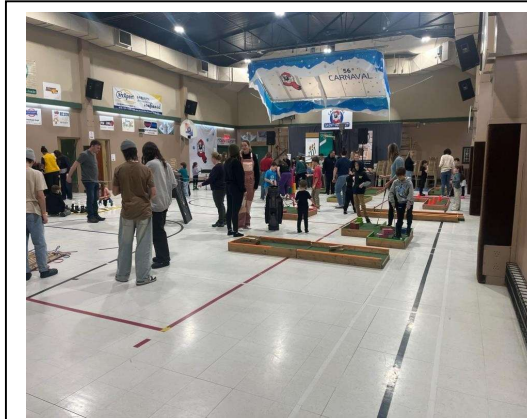
Vue d'ensemble de la Fête Foraine à l'intérieur du centre communautaire où nos jeunes et moins jeunes profitent de toutes les activités.

L'objectif principal : créer un événement entièrement dédié aux jeunes afin de leur offrir un moment de joie, de rires et de divertissement tout en rendant cet événement accessible à toutes les familles.